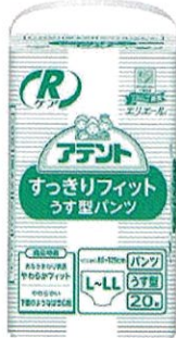
パンツ式紙おむつ