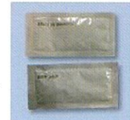
リンスインシャンプー ボディソープ