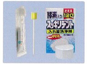
下記いずれか ①歯ブラシ+歯磨き粉 ②マウススポンジ ③入れ歯洗浄剤+入れ歯ケース