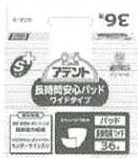
尿取りパッド (昼用・夜用)