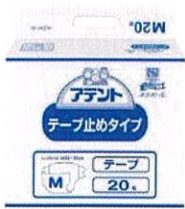
テープ式紙おむつ