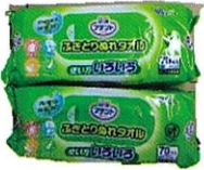
使い捨ておしりふき