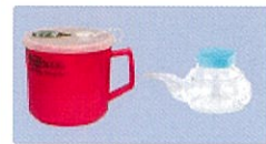
下記いずれか ①吸い飲み②マグカップ