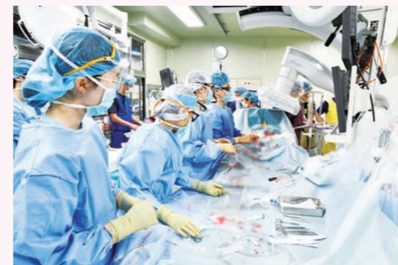
ハイブリッドカテーテル室でのTAVR手術。置換する人工弁を送り込む操作。