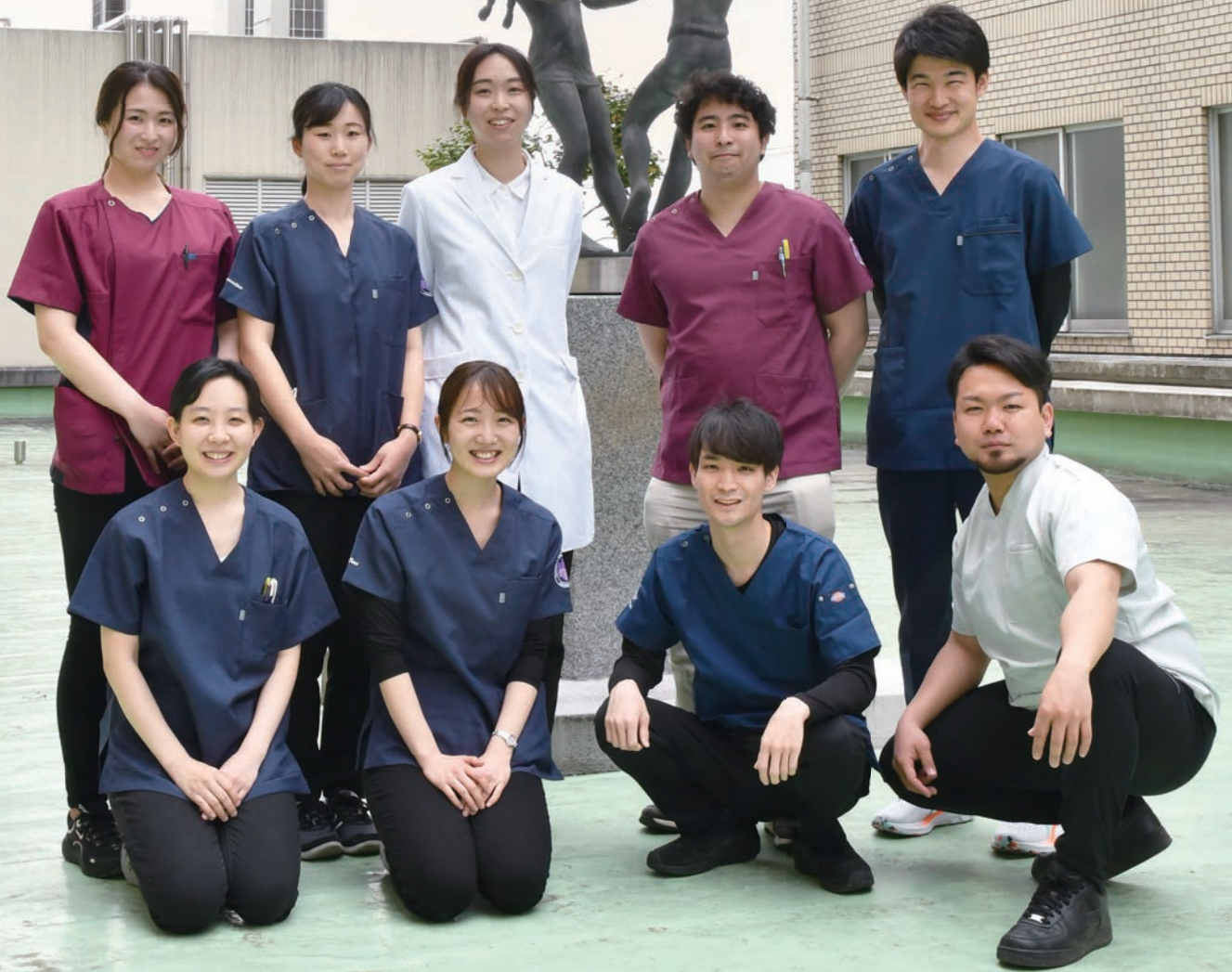
写真 新入職研修医の皆さん